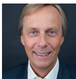
Prof. Dr. Thomas Kersting Krankenhaus

Wir stehen für Ihr Vorhaben bereit. Rufen Sie uns an.